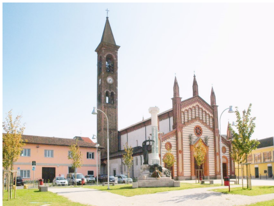
Chiesa Parrocchiale dei SS. Nazario e Celso